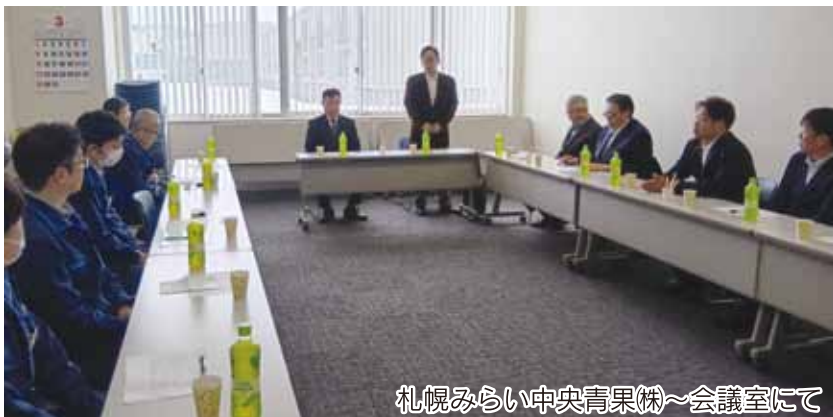
札幌みらい中央青果(株)~会議室にて

その後、青果物のお荷計画について協議がなされました。市場担当者からは、生産資材の高騰が続く中、農産物の出荷に係る経費の高騰を意識して単価を決め、産地に寄り添った対応をしていきたいと話されていました。今後も当産地として各品目担当者と密に連携を取りながら有利販売に努めていきたいと思ひます。