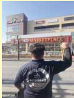
ヤオコー 和光丸山台店にて