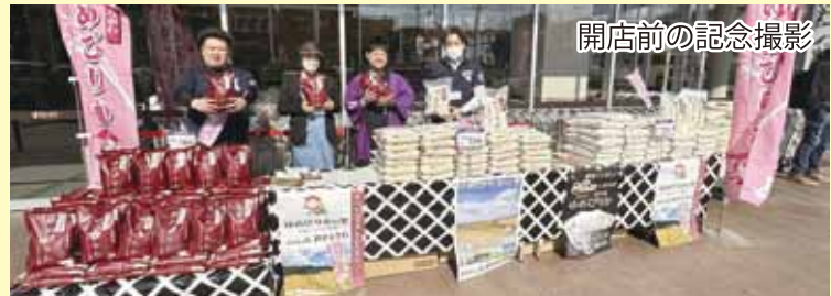
開店前の記念撮影