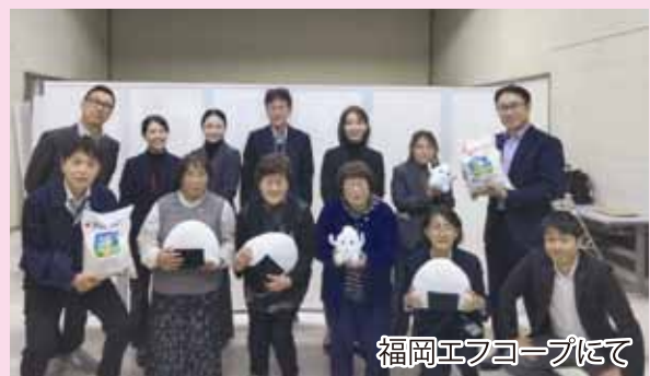
福岡エフコープにて