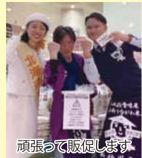
頑張って販促します