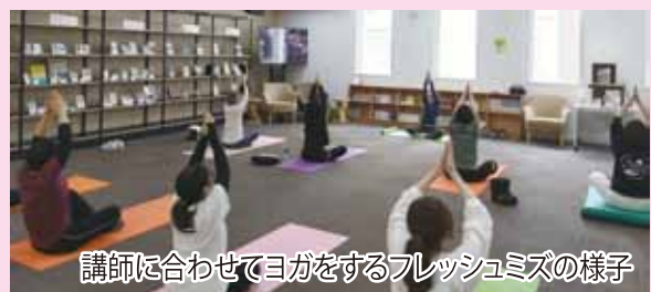
講師に合わせてヨガをするフレッシュミズの様子