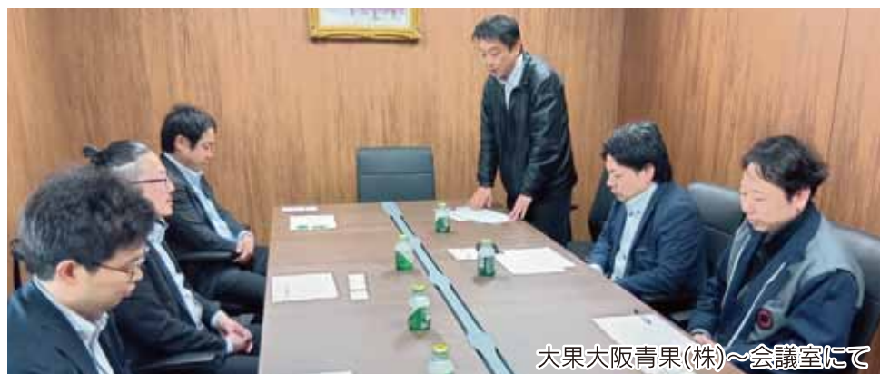
大果大阪青果(株)~会議室にて