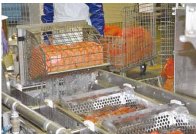
水稻種子温湯消毒作業の様子