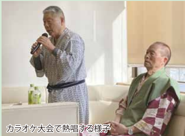
カラオケ大会で熱唱する様子

今回の親睦旅行については、湯治を目的とした旅行プランを企画。滞在中は外への外出はせずに管内にてゆっくりと過ごしていただきました。管内ではこれまでの旅行の様子をまとめたスライドショーの上映やカラオケ大会で盛り上がり、参加者の親睦も深まりました。夕食時には地元食材を用いた料理を堪能し美味しくいただきました。温泉については、美肌の湯、保湿の湯とも呼ばれるやわらかな泉質で、芯から身体を温めてくれる湯とされており、皆さん何回も温泉に入り心身のリフレッシュをされていました。今後も会員の交流につながる企画を予定していきます。