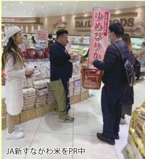
JA新すながわ米をPR中

当日は、北海道米アンバサダーおよび関係卸とともに炊飯試食の提供やお米のこだわりについてのPR、購買促進を目的としたノベルティの配布を行い、2店舗2日間合計で338点（4kg）慣行米242袋、2kg高度CL米96袋の販売につながりました。「ゆめぴりか」を初めて試食し、新たに購入いただいたお客様もおり、今後もリピーターの確保に向け、高品質でおいしい「ゆめぴりか」の生産を継続していくことが重要と捉えています。なお、販売についてはJA・ホクレン・卸を通じてヤオコーへ供給しています。ヤオコーの田口バイヤーからは、「JA新すながわ米は引き続き需要があり販売拡大が見込まれる。」このことから、需要に応えるためにもより一層のJAへの出荷拡大にご協力下さいますようお願い申し上げます。