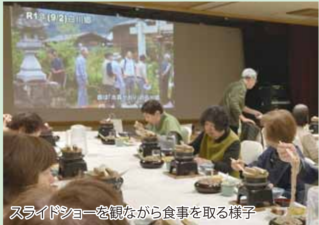
スライドショーを観ながら食事をする様子