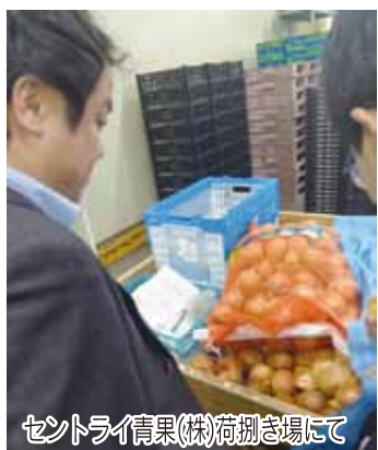
セントライ青果(株)荷捌き場にて