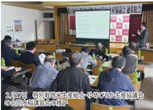
2月17日 特別栽培米生産組合・ゆめぴりか生産協議会 の合同水稻講習会の様子