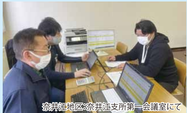
奈井江地区:奈井江支所第一会議室にて