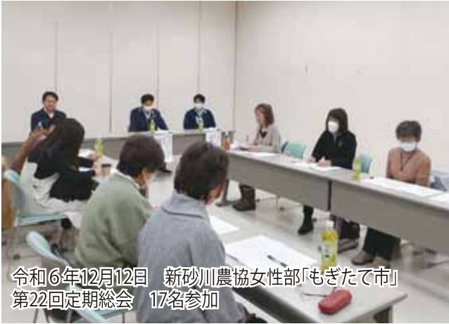
令和6年12月12日 新砂川農協女性部「もぎたて市」 第22回定期総会 17名参加