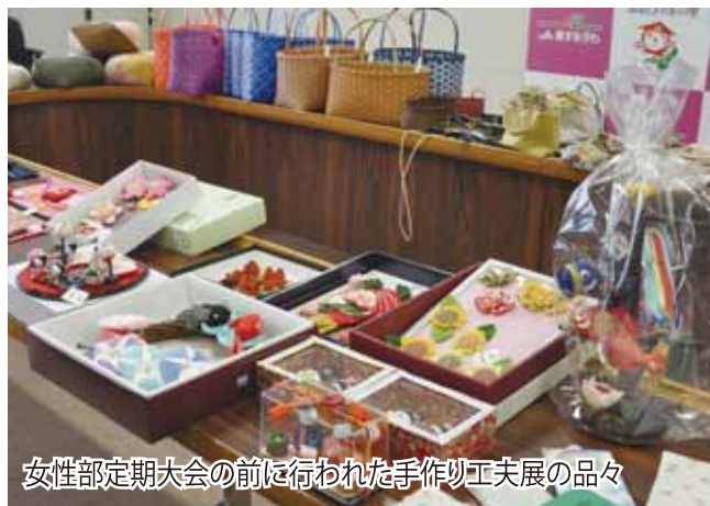
女性部定期大会の前に行われた手作り工夫展の品々