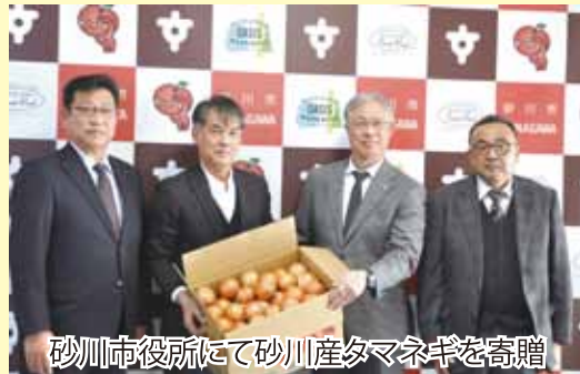
砂川市役所にて砂川産タマネギを寄贈

今回寄贈した玉葱は2月5日、砂川市や奈井江町を含めた1市3町の小中学校(約1,550食)で麻婆カレーに加工して使用されました。