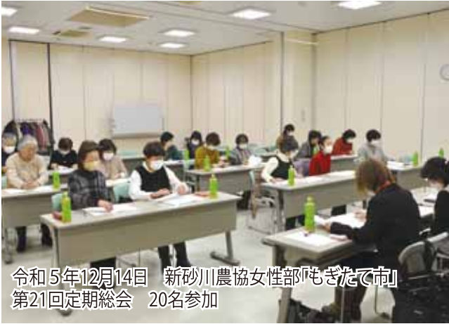
令和5年12月14日 新砂川農協女性部「もぎたて市」 第21回定期総会 20名参加