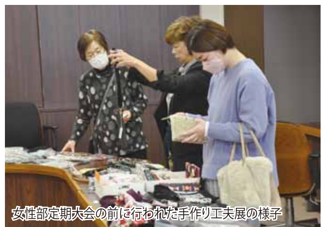
女性部定期大会の前に行われた手作り工夫展の様子