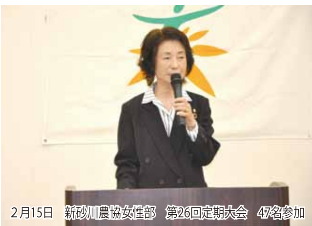
2月15日 新砂川農協女性部 第26回定期大会 47名参加