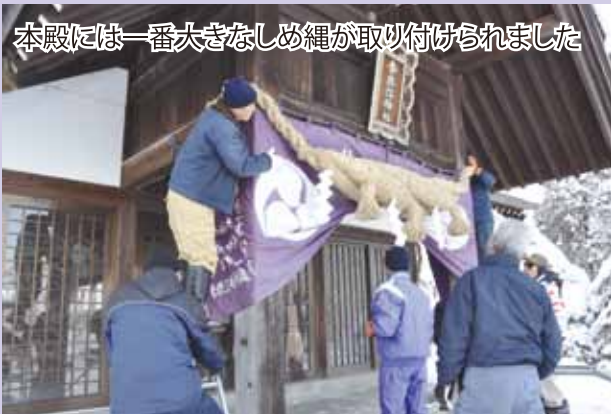
本殿には一番大きなしめ縄が取り付けられました