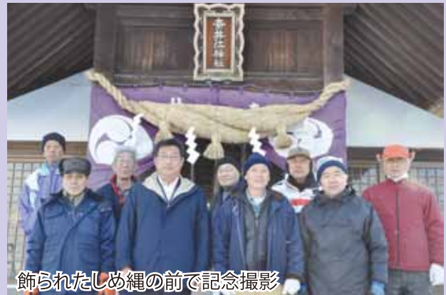
飾られたしめ縄の前で記念撮影