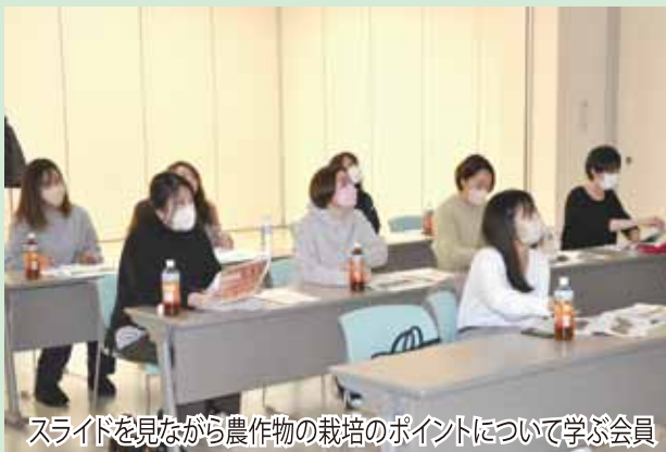
スライドを見ながら農作物の栽培のポイントについて学ぶ会員

フレッシュミズでは、今後も野菜作りや農業に関する勉強会を行い、料理づくりや食育活動も行っていく方針です。