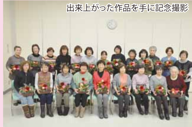
出来上がった作品を手に記念撮影