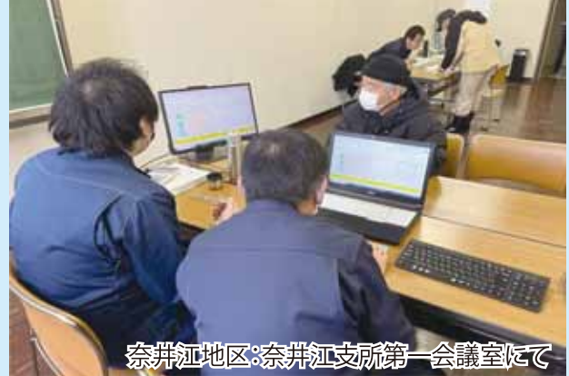
奈井江地区：奈井江支所第一会議室にて