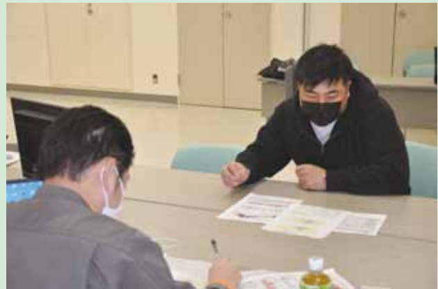
資料をもとにアドバイスを受ける生産者

栽培管理や土壌分析結果を基にした肥培管理を行うことで、収量増大と正品化率向上を目指します。