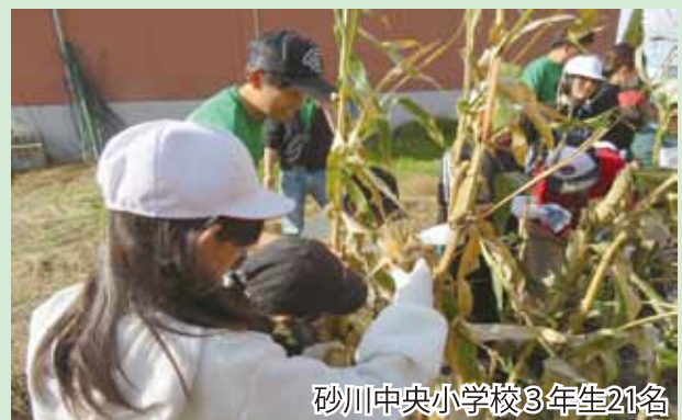
砂川中央小学校3年生21名