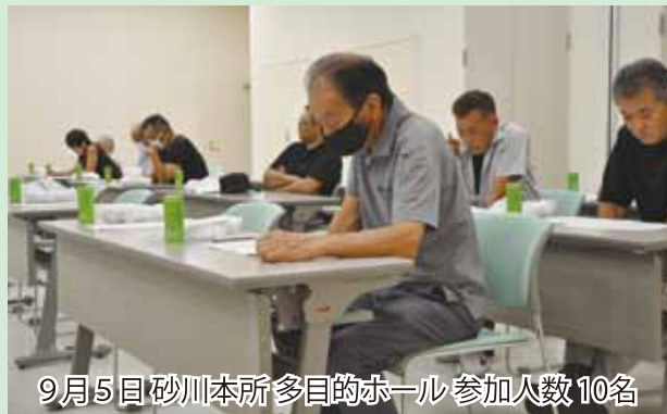
9月5日砂川本所多目的ホール 参加人数10名

今回寄せられた質問や意見については、今後のJ A 運営に活用させていただきますので、今後もよろしくお願いいたします。