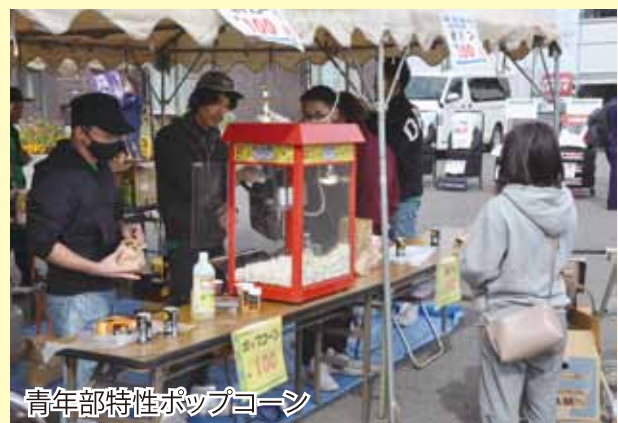
青年部特性ポップコーン