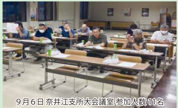
9月6日奈井江支所大会議室 参加人数11名