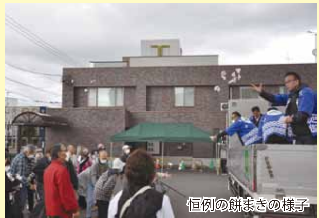
恒例の餅まきの様子