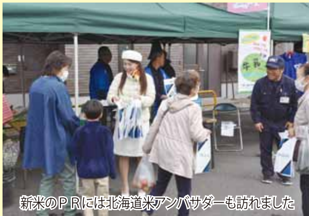
新米のPRには北海道米アンバサダーも訪れました