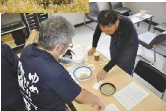
下見検査で結果を確認する 生産者(砂川富農資材センター)