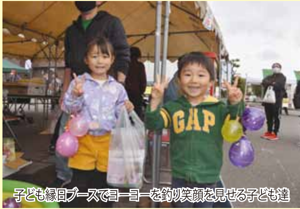
子ども縁日ブースで目ー目ーを釣り笑顔を見せる子ども達