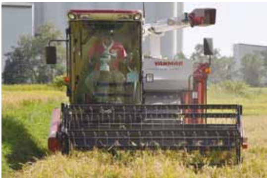
稲刈作業を行う有小林農場 (奈井江町茶志内地区8月23日)