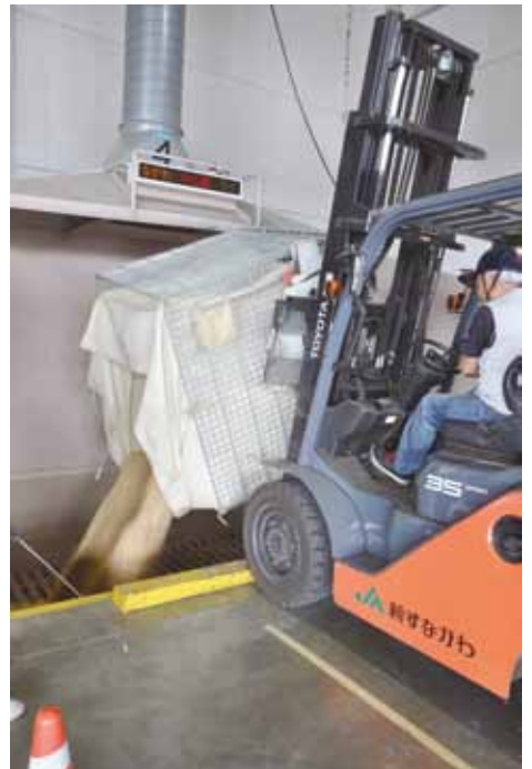
ホッパーへのもみの受入作業