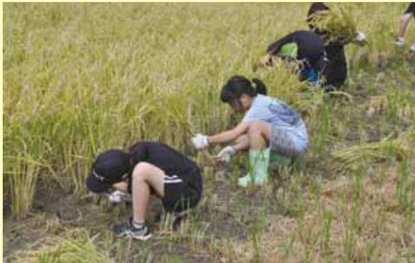
9月13日 砂川中央小学校 5年生18名 砂川市吉野地区 奥山農園さん

水稲生産団体主催の稲刈り体験学習が9月、春の田植え体験に続き地元小学生を対象に行われました。児童達は春に植えた「ゆめぴりか」の小さな苗が大きく成長して黄金色に染まった田を見て、自らが植えた稲が真っ直ぐ育っていることによる喜び、垂れた稲穂にお米の実が入っていることを実感していました。その後、各部会員やJA職員から指南を受けた児童はカマを手に持ち、初めてながらも手際よく株をつかみ次々と稲を刈り取りました。刈り取り後に昔ながらの足踏み脱穀機を使い脱穀体験を行う会場もあり、初めての体験に怖がりながらもみんな楽しんでいました。今回刈り取った稲は体験学習を開いた生産者宅で乾燥調整後各小学校へ配布され、家庭科実習等で使用する予定です。