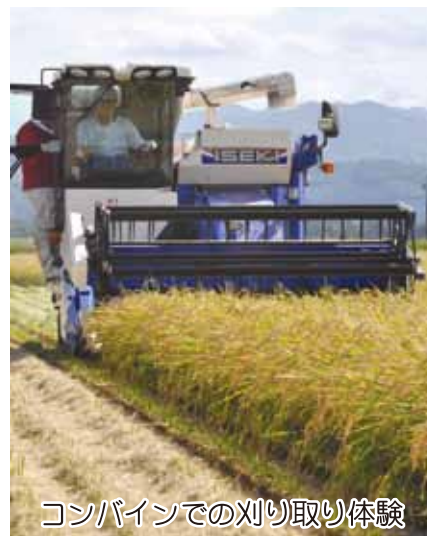
コンバインでの刈り取り体験