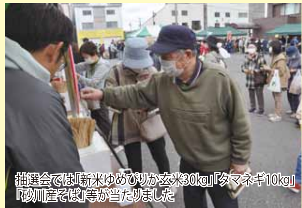
抽選会では「新米ゆめぴりか玄米30kg」「タマネギ10kg」「砂川産そば」等が当たりました