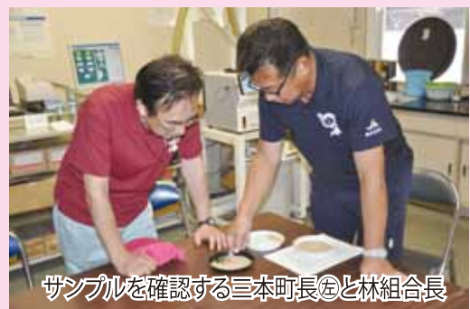
サンプルを確認する三本町長と林組会長

林組会長から「今年は猛暑により生育過程の障害が多く、収量が少ないという生産者の声も多い」ともみの受け入れ状況の説明を受けた三本町長は「ここ数年調子が良かっただけに残念。肥料代も高騰している中で生産者には厳しい年となりそうだ。少しでも多く製品を作り生産者に還元してほしい」と従業員を激励しました。