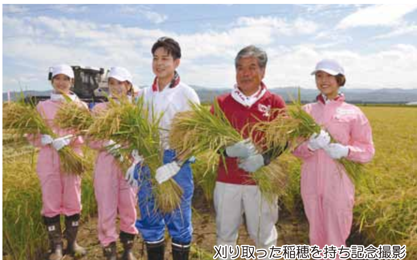
刈り取った稲穂を持ち記念撮影