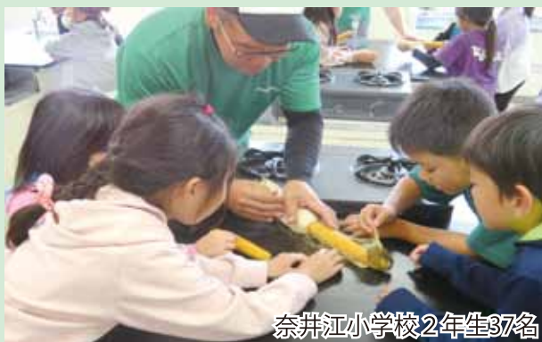
奈井江小学校2年生37名