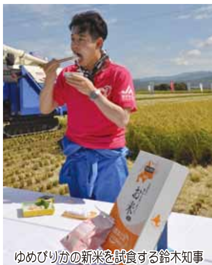
ゆめぴりかの新米を試食する鈴木知事