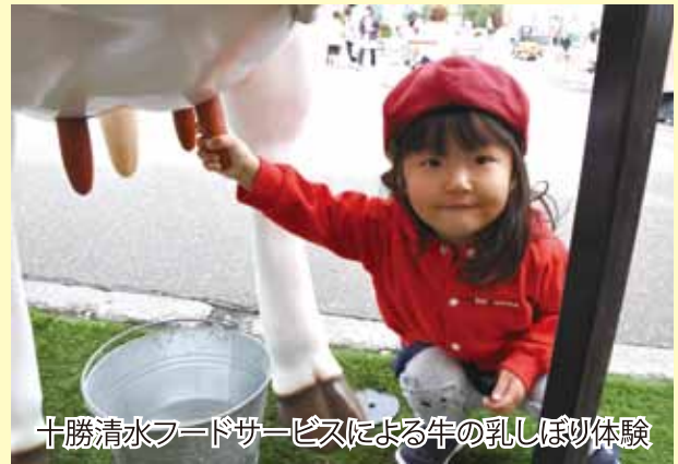
十勝清水フードサービスによる牛の乳しぼり体験