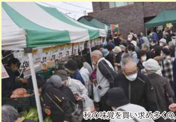
秋の味覚を買い求め多くの人が押し寄せた野菜販売ブース