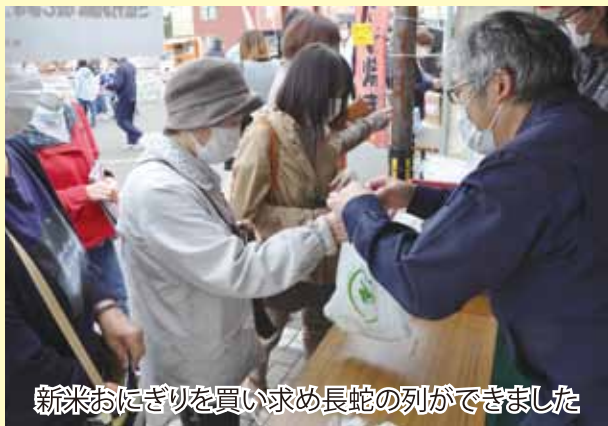
新米おにぎりを買い求め長蛇の列ができました

J Aでは、今後も地域の一員として、農業の発展と健康で豊かな地域社会の実現に向けて事業活動を展開していきますので、組合員皆様のご協力をお願いいたします。