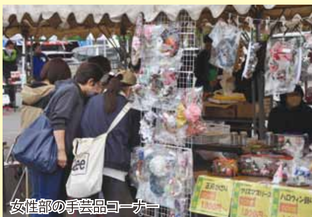
女性部の手芸品コーナー