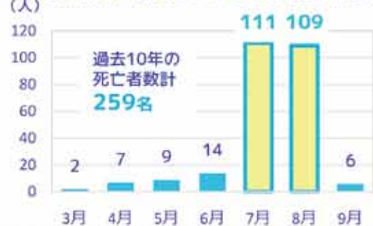
農作業中の熱中症による死亡者数 (月別)