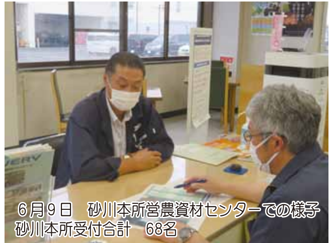
6月9日 砂川本所営農資材センターでの様子 砂川本所受付合計 68名