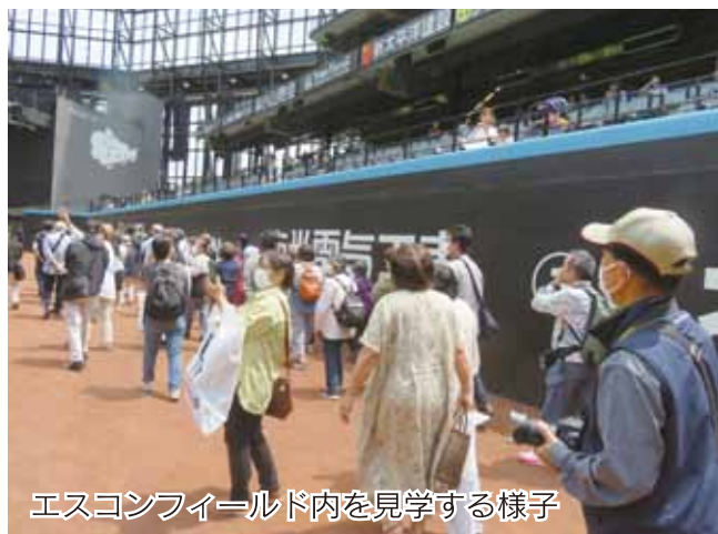
エスコンフィールド内を見学する様子

JA女性部は6月12日、役員・連絡員14名で日帰り研修を行い、今年オープンした北広島市にある「エスコンフィールド北海道」や「くるるの杜」等を見学してきました。エスコンフィールドではスタジアムツアーに参加し、新しい球場の魅力や十分に堪能しました。また、くるるの杜では直売所にてどのような商品が陳列され、人気があるのかを研究しました。三井アウトレットパーク札幌北広島にも立ち寄り、久しぶりに農作業から解放されたみなさんは笑顔で買い物を楽しみました。