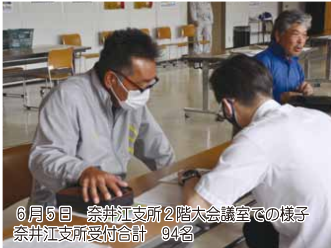
6月5日 奈井江支所2階大会議室での様子 奈井江支所受付合計 94名

6月5日から9日までJA本支所で経営所得安定対策交付制度の加入申請を受付しました。