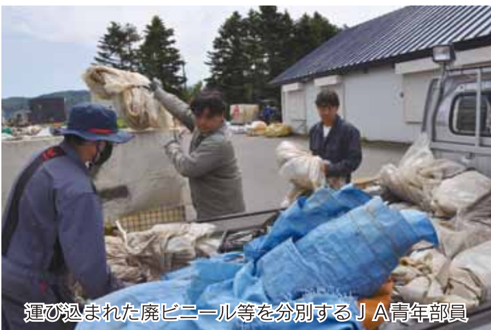
運び込まれた廃ビニール等を分別するJ A青年部員

営農課はJ A青年部と共同で6月22日と23日、奈井江町のJ A施設敷地内で廃プラスチック等の受け入れ作業を行いました。 生産者が持ち込んだ約43トン(前年約44トン)のビニールやポリ袋・肥料袋、プラスチック等を分別し、北斗市の日本公防株式会社でリサイクルします。 J Aでは年2回、回収作業を行っており、次回は10月下旬を予定しています。