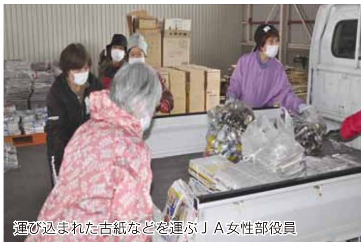
運び込まれた古紙などを運ぶJA女性部役員

JA女性部は6月2日、奈井江町のJA施設で古紙や段ボール、アルミ缶などを回収しました。女性部員が持ち込んだ古紙などをJA営農部職員と分別して地元のリサイクル業者に売り、女性部の運営資金の一部にしています。年々持ち込み量が減少していましたが、今回は昨年より若干多いとのこと。女性部は「秋にも回収を行うのでご協力」と呼び掛けています。