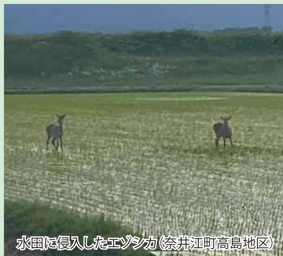
水田に侵入したエゾシカ(奈井江町高島地区)

田植え後の水田に侵入して走り回ったり、稲を食べたりすると収量減につながるため、生産者にとっては深刻な問題となっています。侵入防止の電気柵が唯一の自衛手段となりますが、十分な効果は発揮できてなく、生産者も頭を悩ませていて、今後は行政と連携した被害対策が望まれます。