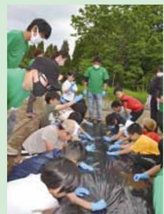
6月9日 砂川中央小学校 3年生 22名