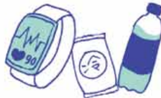
ウェアラブル端末、 応急セット