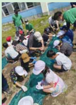
6月6日 奈井江小学校 2年生 37名

収穫は10月を予定しており、みんなで収穫作業をしたり、ポップコーンを作ったりして、児童に食べ物を作る大切さを学んでもらう予定です。