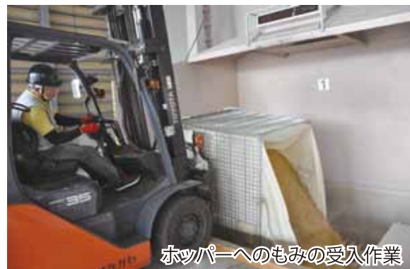
ホッパーへのもみの受入作業