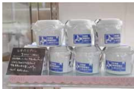
☞ 牛乳本来の味を楽しめる 「しぼりたてプリン」