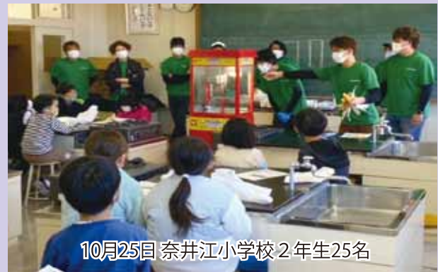
10月25日 奈井江小学校2年生25名