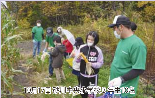
10月17日 砂川中央小学校3年生10名

今回収穫したとうもろこしは、各自持ち帰り、それぞれの家庭で3～4か月ほど乾燥させた後、食べる予定です。