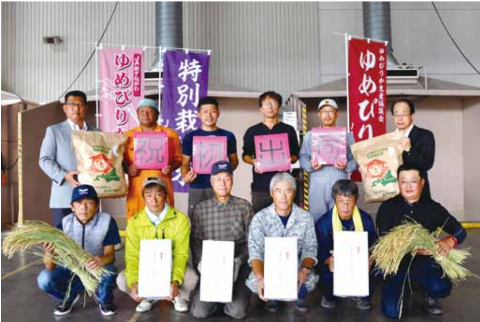
←本年度の初出荷を祝う生産者の皆さん