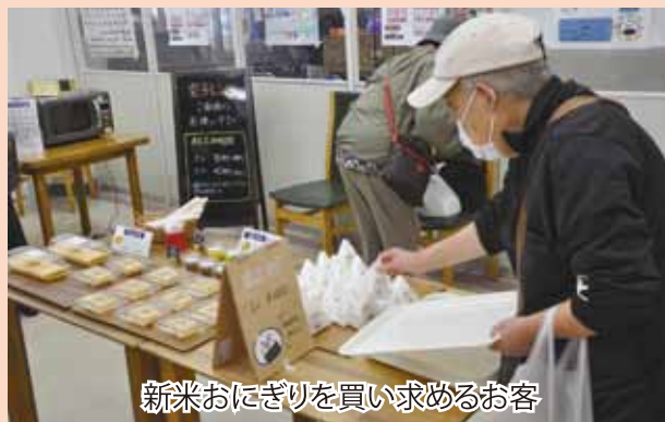
新米おにぎりを買求めるお客