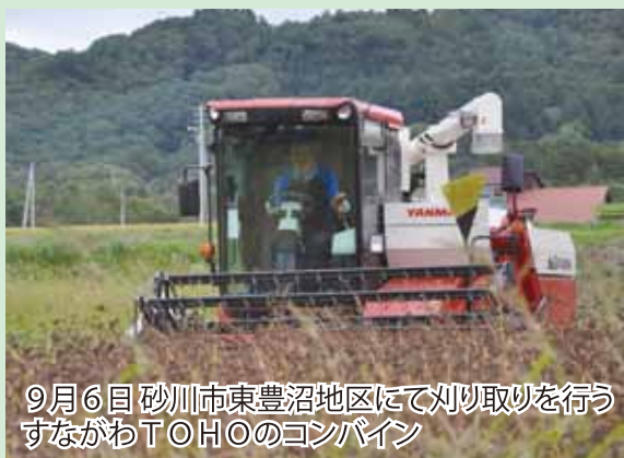
9月6日 砂川市東豊沼地区にて刈り取りを行う すながわT.O.H.O.のコンバイン

当初は、生育初期の降雨により湿害を受けたほ場が多く減収が見込まれましたが、品質は良くJA全体では3,569俵（前年3,490俵）の受け入れとなりました。