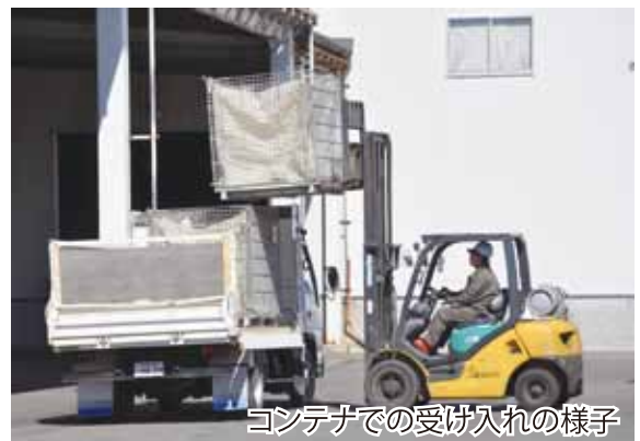
コンテナでの受け入れの様子