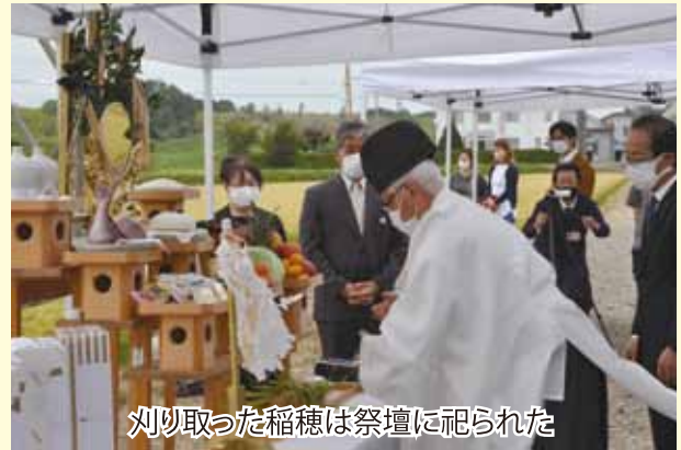
刈り取った稲穂は祭壇に祀られた