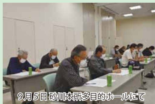
9月5日砂川本所多目的ホールにて

懇談会では、令和4年産米の概算金や水田活用交付金に対する質問等が多く寄せられました。