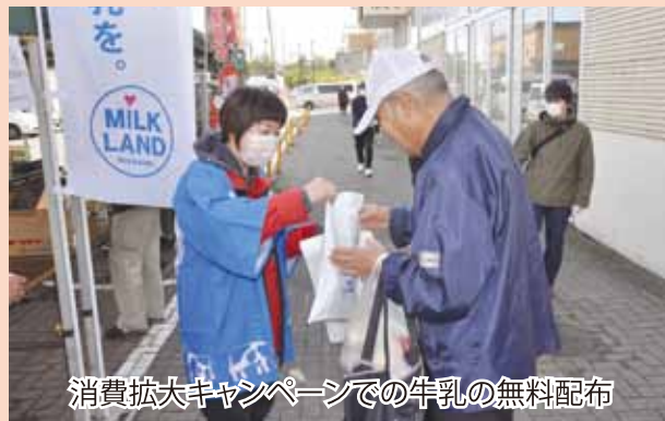
消費拡大キャンペーンでの牛乳の無料配布