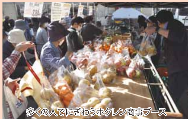
多くの人でにぎわうホクレン商事ブース