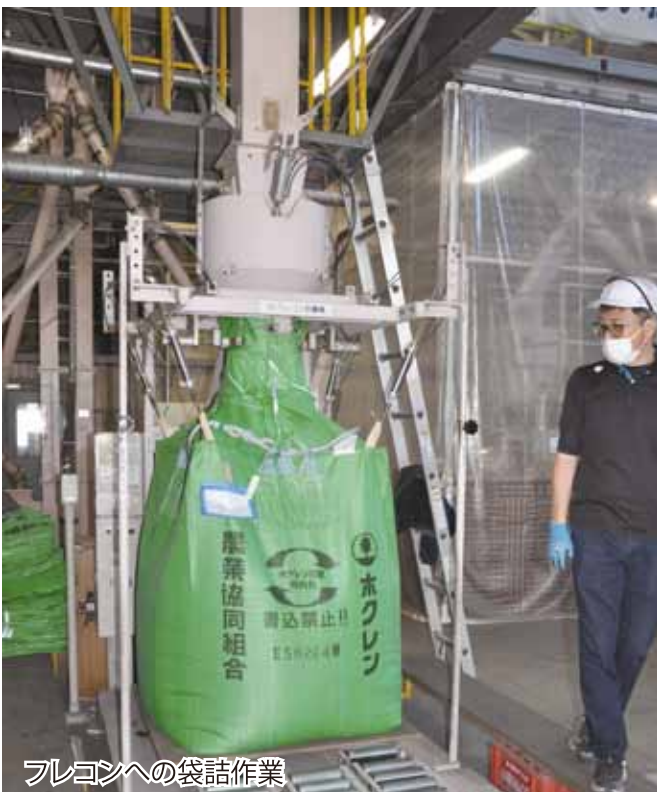
フレコンへの袋詰作業