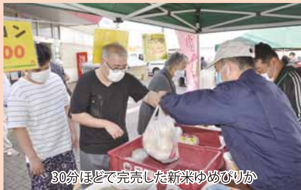
30分ほどで完売した新米ゆめぴりか