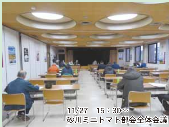
11/27 15:30~ 砂川ミニトマト部会全体会議