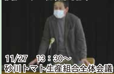
11/27 13:30~ 砂川トマト生産組合全体会議