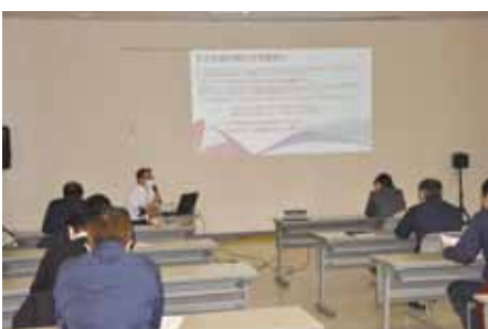
3密を避けて開催された研修会の様子

研修では、川下管理課長が、同一賃金、パートタイム・有期雇用労働法などについて説明し、質疑では、通常労働者への転換措置や待遇格差、賃金格差についてそれぞれの意見が取り交わされ、同課長は「コロナの影響等により収支は厳し状況ですが、皆さんの英知を出し合い協力をお願いしたい。」と話しました。