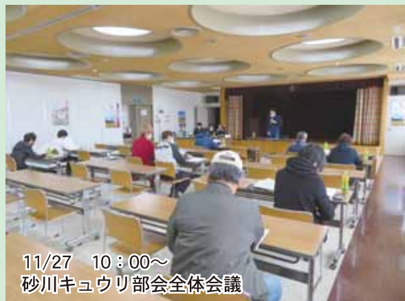
11/27 10:00~ 砂川キュウリ部会全体会議